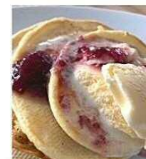
パンケーキ & アイス