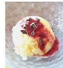
カカオニブとアイス